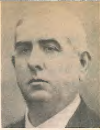
Francisco Lema «Fosforito»